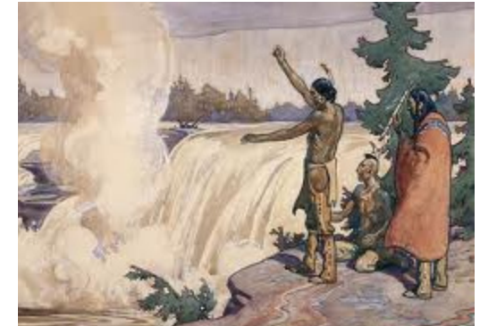
Image: Peinture de C. W. Jefferys, au www.ameriquefrancaise.org Texte tiré en partie de l'article du 25 nov. 2015 de Greg Macdougall, EquitableEducation.ca , traduit par Elise Mennie.